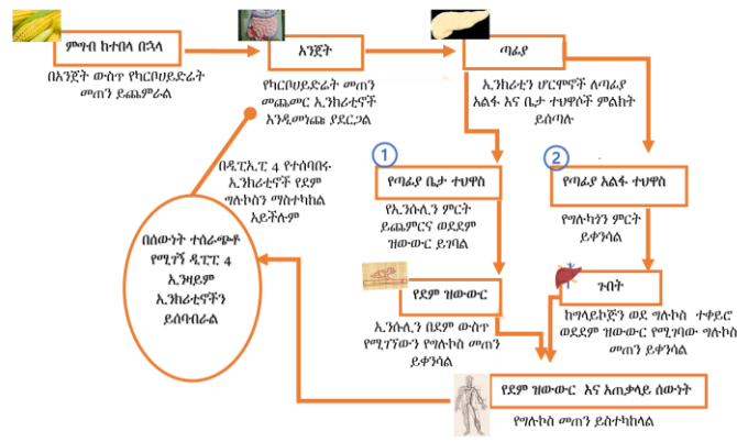
ኢንክሪቲኖች ከአንጀት መንጭታው በዲፐፐ 4 እስከሚሰባሰቡ ድረስ የደም ግሉኮስ በሰውነት እንዲስተካከል ያደርጋሉ። ዲፐፐ 4 ን የሚያግዱ መድሃኒቶች የኢንክሪቲን ሆርሞኖች ቶሎ እንዳይሰባሰቡ ያደርጋሉ።

አንድ ሰው ምግብ ሲበላ ወይም የደም ግሉኮስ ከፍ ሲል ኢንክሪቲን የሚባሉ ሆርሞኖች አንጀት አከባቢ ይመነጫሉ። ኢንክሪቲኖች በጣፊያ ውስጥ የኢንሱሊን ምርት እንዲጨምር እንዲሁም የግሉኮስን ምርት እንዲቀንስ ምልክት ይሰጡታል። የኢንሱሊን መጠን መጨመር በደም ያለውን የግሉኮስ መጠን ይቀንሳል። በአንጻሩ ከጣፊያ የሚመረተው እና የሚመነጨው የግሉኮስን መጠን መቀነስ በጉበት ውስጥ ተከማችቶ የሚቀመጠውን ግላይኮጅን ወደግሉኮስ ተለውጦ ወደደም ዝውውር እንዳይገባ ያደርገዋል። ስለዚህ የኢንሱሊን ምርት በመቆጣጠር ኢንክሪቲኖች የደም ግሉኮስን ይቀንሳሉ። የደም ግሉኮስ የሚፈለገውን ያህል ዝቅ ካለ በኋላ ዲፐፐ 4 የሚባሉ ኢንክሪቲኖችን በሚገኝበት የአንጀት አከባቢ ይመነጫሉ። ኢንክሪቲኖችን በመሰባሰብ ለጣፊያ የሚሰጡትን ምልክት እንዲቆም ያደርጋሉ።