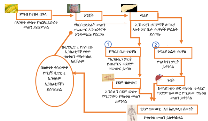
ኢንክሪቲኖች ከአንጀት መንጭታው በዲፒፒ እስከሚሰባሰቡ ድረስ የደም ግሉኮስ በሰውነት እንዲሰተካከል ያደርጋሉ። ዲፒፒ 4 ን የሚያግዱ መድሃኒቶች የኢንክሪቲን ሆርሞኖች ቶሎ እንዳይሰባሰቡ ያደርጋሉ።

አንድ ሰው ምግብ ሲበላ ወይም የደም ግሉኮስ ከፍ ሲል ኢንክሪቲን የሚባሉ ሆርሞኖች አንጀት አከባቢ ይመነጫሉ። ኢንክሪቲኖች በጣፊያ ውስጥ የኢንሱሊን ምርት እንዲጨምር እንዲሁም የግሉካን ምርት እንዲቀንስ ምልክት ይሰጡታል። የኢንሱሊን መጠን መጨመር በደም ያለውን የግሉኮስ መጠን ይቀንሳል። በአንጻሩ ከጣፊያ የሚመረተው እና የሚመነጨው የግሉካን መጠን መቀነስ በጉበት ውስጥ ተከማችቶ የሚቀመጠውን ግላይኮጅን ወደግሉኮስ ተለውጦ ወደደም ዝውውር እንዳይገባ ያደርገዋል። ስለዚህ የኢንሱሊን ምርት በመቆጣጠር ኢንክሪቲኖች የደም ግሉኮስን ይቀንሳሉ። የደም ግሉኮስ የሚፈለገውን ያህል ዝቅ ካለ በኋላ ዲፒፒ 4 የሚባሉ ኢንዛይሞች ኢንክሪቲን በሚገኝበት የአንጀት አከባቢ ይመነጫሉ። ኢንክሪቲኖችን በመሰባሰብ ለጣፊያ የሚሰጡትን ምልክት እንዲያቆም ያደርጋሉ።