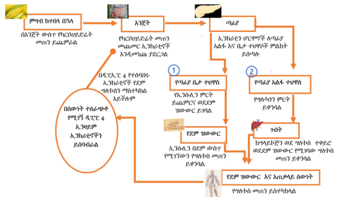
ኢንክሪቲኖች ከአንጀት መንጭታው በዲፒፒ እስከሚሰበሰቡ ድረስ የደም ግሉኮስ በሰውነት እንዲስተካከል ያደርጋሉ። ዲፒፒ 4 ን የሚያግዱ መድሃኒቶች የኢንክሪቲን ሆርሞኖች ቶሎ እንዳይሰበሰቡ ያደርጋሉ።

አንድ ሰው ምግብ ሲበላ ወይም የደም ግሉኮስ ከፍ ሲል ኢንክሪቲን የሚባሉ ሆርሞኖች አንጀት አከባቢ ይመነጫሉ። ኢንክሪቲኖች በጣፊያ ውስጥ የኢንሱሊን ምርት እንዲጨምር እንዲሁም የግሉካንን ምርት እንዲቀንስ ምልክት ይሰጡታል። የኢንሱሊን መጠን መጨመር በደም ያለውን የግሉኮስ መጠን ይቀንሳል። በአንጻሩ ከጣፊያ የሚመረተው እና የሚመነጨው የግሉካን መጠን መቀነስ በጉበት ውስጥ ተከማችቶ የሚቀመጠውን ግላይኮጅን ወደግሉኮስ ተለውጦ ወደደም ዝውውር እንዳይገባ ያደርገዋል። ስለዚህ የኢንሱሊንን ምርት በመቆጣጠር ኢንክሪቲኖች የደም ግሉኮስን ይቀንሳሉ። የደም ግሉኮስ የሚፈለገውን ያህል ዝቅ ካለ በኋላ ዲፒፒ 4 የሚባሉ ኢንዛይሞች ኢንክሪቲን በሚገኝበት የአንጀት አከባቢ ይመነጫሉ። ኢንክሪቲኖችን በመሰባሰብ ለጣፊያ የሚሰጡትን ምልክት እንዲያቆም ያደርጋሉ።