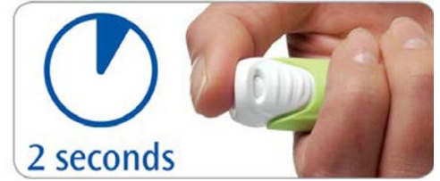
ስዕል 11 መርፌውን መውጋት