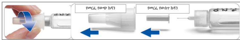
ስዕል 5 የፔን መርፌውን መግጠም