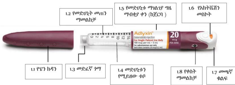
ስዕል 2 የሊክሲሶናታይድ 20 ማይክሮግራም ፔን የተለያዩ ክፍሎች

ሁለተኛው አይነት ቀይ በርገንዲ ቀለም አለው። ይህ መድሃኒቱ ከተጀመረ ከ15 ቀን አንስቶ ይወሰዳል። ይህ ቀይ በርገንዲ ፔን ሲወጋ በአንድ ጊዜ 20 ማይክሮግራም ሊክሲሶናታይድ መስጠት ይችላል።