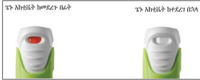
ስዕል 9 የአክትቪቭን መስኮቱ ቀለም ይለወጣል