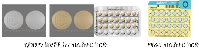
የያዝምን ክኒኖች እና ብሊስተር ካርድ

ለዚህ ጽሁፍ እንደምሳሌ የምንወስደው የያዝምንን ክኒኖች ቀለም ነው። ለአንድ ወር የሚሆን የያዝምን ብሊስተር ካርድ ሆኖ አንድ ቢጫ ክኒኖች እና ሰባት ነጭ ክኒኖች ይኖሩታል። ነገር ግን እንደአገሩ እና እንደአምራቹ የተለያዩ ቀለም ያላቸው ክኒኖች ይኖራሉ። ለምሳሌ የዛራሀ ክኒኖች ሆኖ አንድ ሰማያዊ እና ሰባት ቢጫ ክኒኖች አሉት።